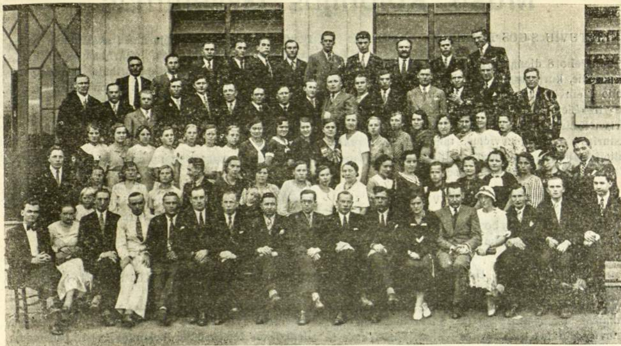
B. L. J. S-Ų «Viltis» Bomi Retiro, Mokos ir Vila Belos skyrių bendras susirinkimas, įvykęs šių metų birželio 2 dieną, Dr. V. Kudirkos vardo rūmuose.