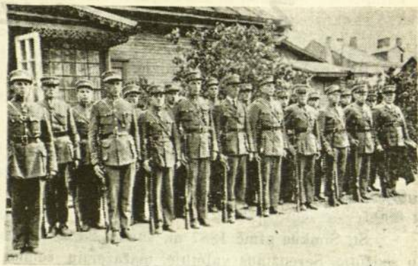
Lietuvos šaulių būrys.

1) kaukės skirtos moterims, seniams bei vaikams (vadinamais paprastai šalies gyventojais) neturi kitokio tikslo, kaip tik leisti asmeniui, kuris ją vartoja, apsaugoti nuo kenksmingo dujų veikimo tiek, kiek reikalinga, kad apėidus savo gyvenamą vietą, pasiekti kolektyvinio apsigynimo centrus. Pagal savo vartojimą tokios kaukės turėtų būti labai patogios, paprastos konstrukcijos ir be to dar pigios. Visos tokios gyventojams skiriamos kaukės, prieš įsigijant, turi būt patiektos tam tikroms karo įstai-goms, kad patikrinus, ar jos atitinka statytiems tikslams.