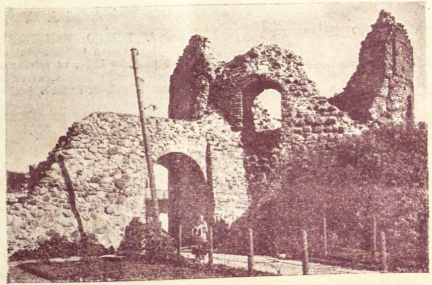
Kauro Pilies griuvėsiai.