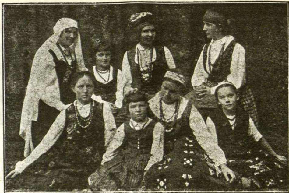
Lietuvaitės tautiškais rūbai.