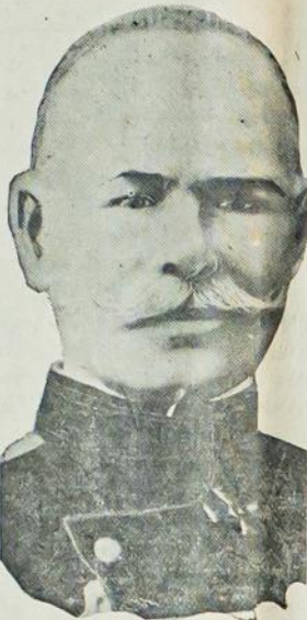
Gen. Aleksejev. Jis komanduoja visą rusų armiją Lenkijoje.