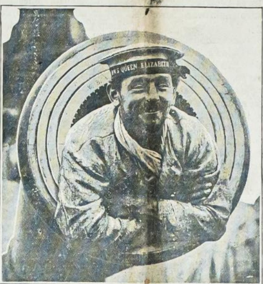
Šitas paveikslėlis parodo anglų jureivį, įlindusį į 15-colinę Anglijos karo laivo "Queen Elizabeth" kanuolę. Tas laivas veikia Dardaneliuose.

Petrogradas, birželio 14 d. — Šiandien išleistas rusų karo štabo oficialis pranešimas praneša sekančias žinias: "Subatoj ėjo smarkūs mušiai ant viso fronto upių Vindavos, Ventos ir Dubisos. Vokiečių pastangos ypač buvo atkreitos į apilinkes į šiaurį nuo Šiaulių. "Užnemunij, Suvalkų