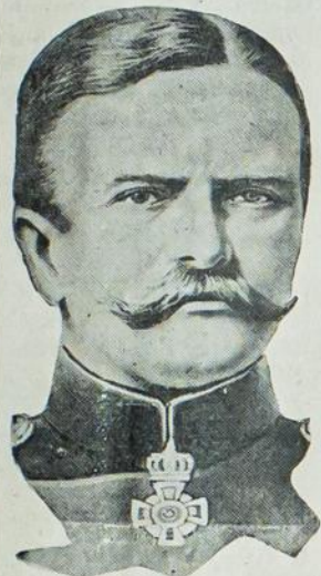
Gen. von Mackensen.

Milwaukee, Wis. — Su- virš 100 saliuoninkų žada už- daryti savo bižnius dėlei se- kančių priežasčių: Europos karo, blogų laikų ir dėl to, kad žmonės daugiau lanko krutančius paveikslus bei vodevilius, negu saliuonus. Jie tvirtina, kad nei ant pra- gyvenimo neuždėrė.