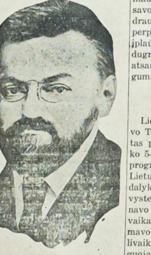
Charles P. Steinmetz. Elektrikos inžinierius, kuris nori išrasti povandeninį kreiserį.

Rugiai šiuo laiku labai gražūs, bet daug yra kareivių numintų, tokių nelikę nei žymės. Vasarajui reikia lietaus. Žolė ir dobilai taip-pat dėl sausumos neauga. Soduose obuolių, vyšnių ir griušių bus labai mažai, bet laukų derlius, kaip seni žmonės pranašauja, šiemet bus siašs geras.