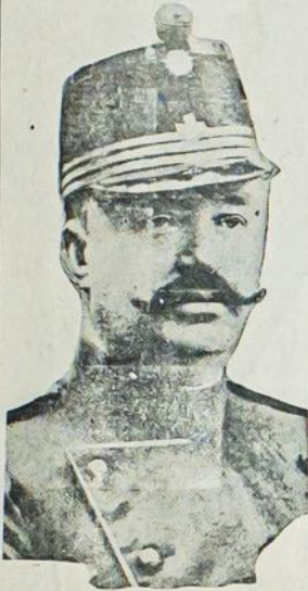
Gen. V. Wille.