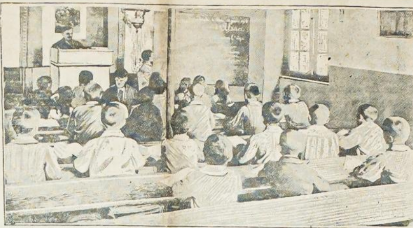
Francuzų mokykla alzacijoje, kur mokytojauja francuzai mokytojai vieton vokiečių.

"Jacobstadt (Jekabmiesto) rajone buvo artilerijos ir šautuvais šaudymasi. Prieš