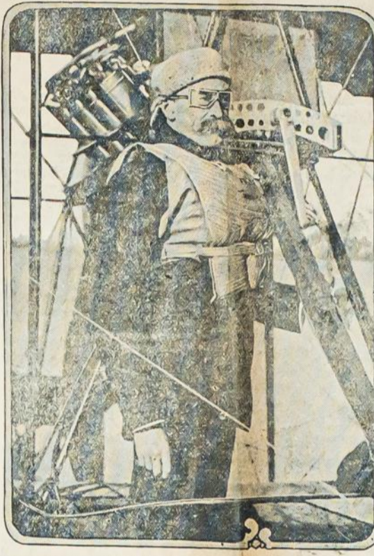
Kontr-admirolas Robert E. Peary, šiaurinio poliaus atradėjas, norįs tirinėti su pagalba orlaivio šiaurinę žvaigždę.

Lugano, Šveicarijoj. — Laikraštis Informazione rašo, jog vedamos tarpe Rusijos ir Rumunijos tarybos delei sutarties artinasi jau prie pasekmingos užbaigos. Kol laukiama, idant Rumunija pavelytų gabenti per savo žemę rusų kariuomenę, Rusija laikinai sustabdė rengimasi išsodinti savo kariuomenes ant Bulgarijos pakraščio prie Juodųjų jurių.