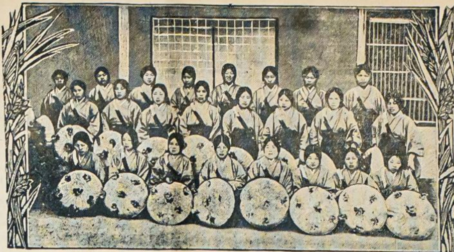
Japonietės, kurios turi dalyvauti japonų karaliaus vainikavimo iškilmėse. Vainikavimas tęsis visą mėnesį ligi gruodžio 6 d.