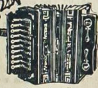
Hohner Accordion 500 coupons