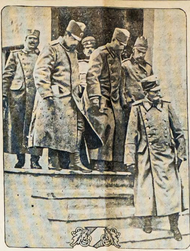
Serbijos karalius Petras ir jo štabas.