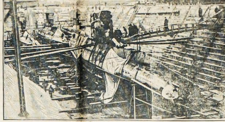
Povandeninė laivė (submarinas) E-2 po eksplozijos.

Petrogradas. — Rusų oficialis pranešimas sako: "Kaukazo fronte mes pa-