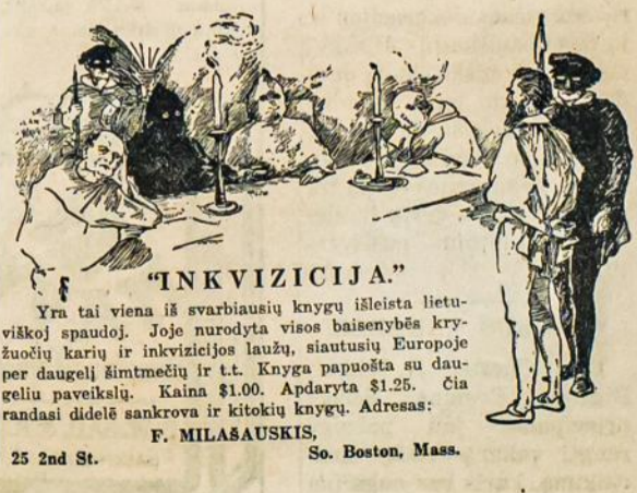
"INKVIZICIJA" Yra tai viena iš svarbiausių knygų išleista lietuviškoj spaudoj. Joje nurodyta visos baisenybės kryžuočių karių ir inkvizicijos laužu, siautusių Europoje per daugelį šimtmečių ir t. t. Knyga papuosta su daugeliu paveikslų. Kaina $1.00. Apdaryta $1.25. Čia randasi didelė sankrova ir kitokių knygų. Adresas: F. MILAŠAUSKIS, 25 2nd St. So. Boston, Mass.

"Blindą" statant scenoje reikia vaduotis beveik grynai estetikiniais (dailės) motyvais. Visuomeniniu