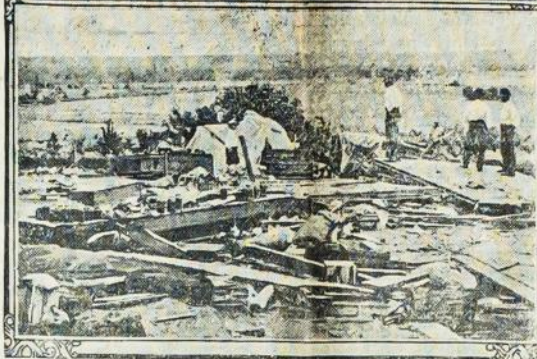
Tornados palikimas. Taip išrodo vietos Kemp City, Okla., po atsilankymo audros.