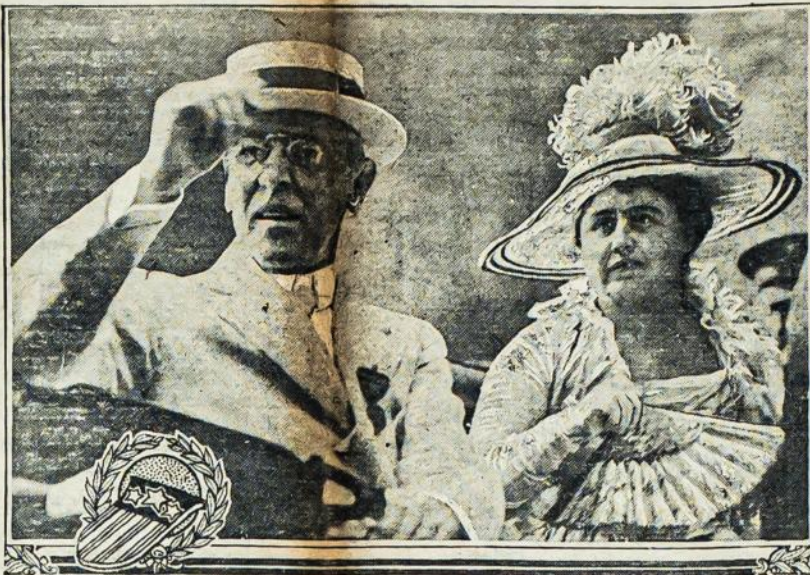
Prezidentas Wilsonas su savo žmona Philadelphijoj. Jiedu dabar labai dažnai važinėjas su tikslu reklamos ir agitacijos. Mat artinasi rinkimai.

Londonas. — Rygos fronte buvo dideli mušiai ir rusai keliose vietose pirmąją fronto liniją perkirto, išiveržė į vokiečių tranšėjas ir smarkiomis atakomis pludo ant vokiečių, kuriuos atstumė atgal 12 mylių. Vokiečiai atstumi nuo Rygos prie Ikskulės. (Išilgai fronte apie 30 mylių).