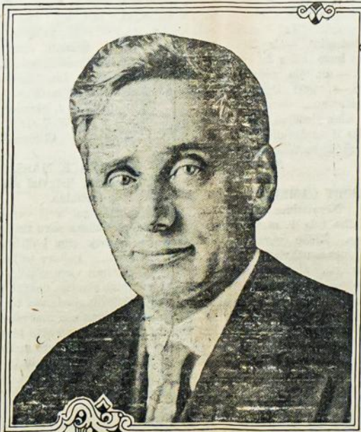
Louis D. Brandeis iš Bostono, kuris neseniai išrinktas Augščiausiojo Teismo nariu rezignavo iš visų žydų komitetų.

Viriausias miestas Christiansted ir didžiausias miestas Charlotte ant St. Thomas salos. Salos turtu yra cukrus, kurio kas metas daug išsiunčiama. Šitos salos del SUV. Valst. turi didelę strategišką (militarų žvilgsniu) vertę. Jos randas į rytus nuo Porto-Rico salos.