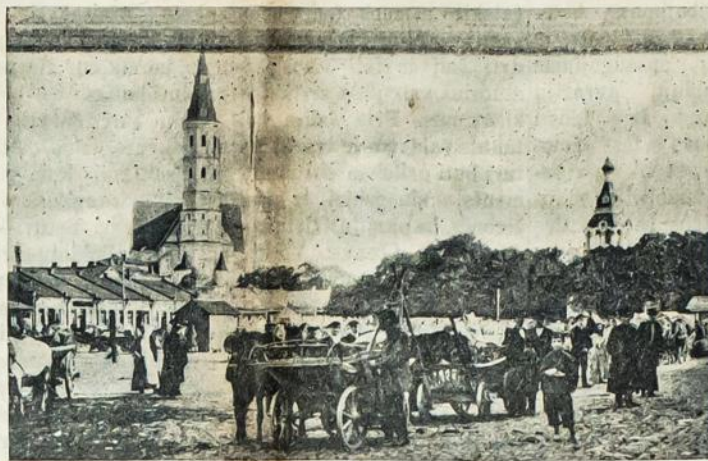
Siauliy, Kauno gub., bažnyčia.

Verduno fronte vokiečiai atakavo Thiaumont fortą