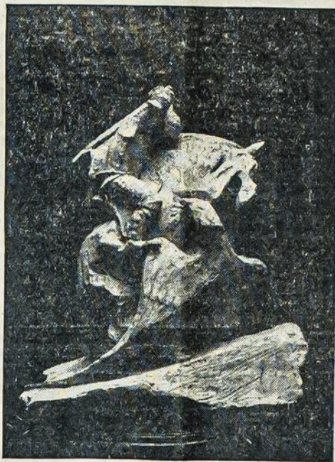
P. Rimšos "Kova".

Kaukazo fronte rusai turi geriausius pasisekimus. Pa- ėmė keletą turkų ir persų miestų ir eina vis artin ang- lų kariuomenės, kuri tuom- laiku yra Bagdado apielin-