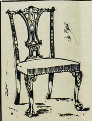
KEDEŠ Nuo 75c. iki $5.00

Užėikite pas mus pažiūrėti, nes mes turim didelį pasirinkimą ir visokių kainų 50c. iki $5.00. Taipgi marškinių įvairių gatunkų ir čėverykų iš geriausios skuros padarytų turim.