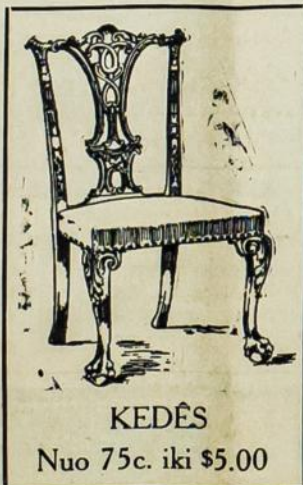
KEDĖS Nuo 75c. iki $5.00

Užėikite pas mus paziurėti, nes mes turim didelį pasirinkimą ir visokių kainų 50c. iki $5.00. Taipgi marškinių įvairių gatunų ir čeverykų iš geriausios skuros padarytų turim.