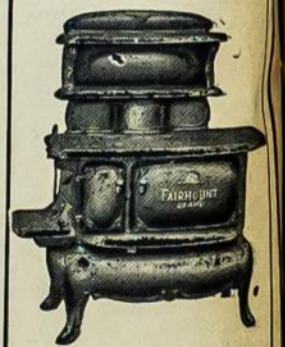
PEČIAI Nuo $30 iki $75.00

Kurie manote pirkt Stubos Rakandus, tai nelaukit nei vienos dienos, nes visoki tavorai kasdiena brangsta. Pas mus galite gauti gražiausiu Lovu, Kamodu, Pečiu, Kedžiu, Karpetu, Kaldru, Padšuku ir t. t. Patarnavimas pirmos kliasos.