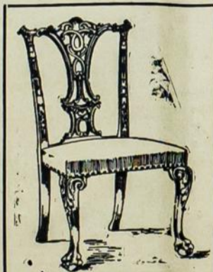
KEDĖS Nuo 75c. iki $5.00

Užeikite pas mus paziurėti, nes mes turim didelį pasirinkimą ir visokių kainų 50c. iki $5.00. Taipgi marškinių įvairių gatunų ir čeverykų iš geriausios skuros padarytų turim.