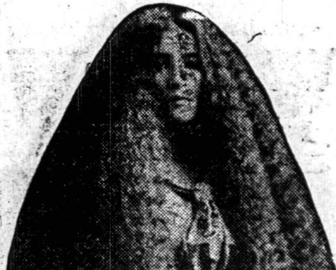
Fotografija - ne retusuota