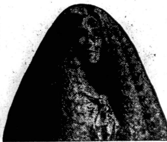
Fotografija- ne retusuota