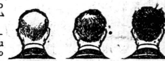
Nusisekęs mokslinis gydymas.

ilustruotą knygā "Pergalėjimas plikimo per mokslo" ir pavyzdžiui Calvacura.