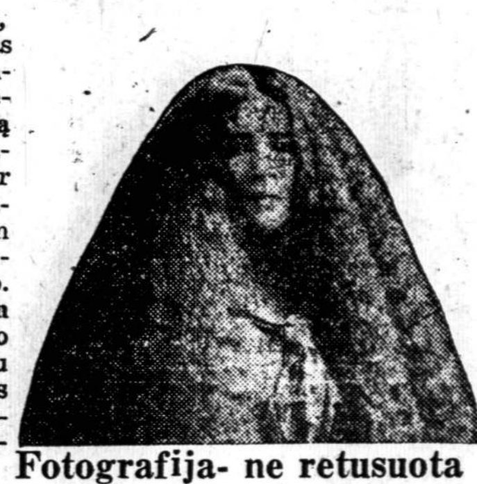
Fotografija- ne retusuota

Laukti yra pavojim-ga. Jeigu kenti nuo bile kurių virš mīmētų plaukų ligų, neatidėk, bet gydyk tuojaus. Prisiųsim