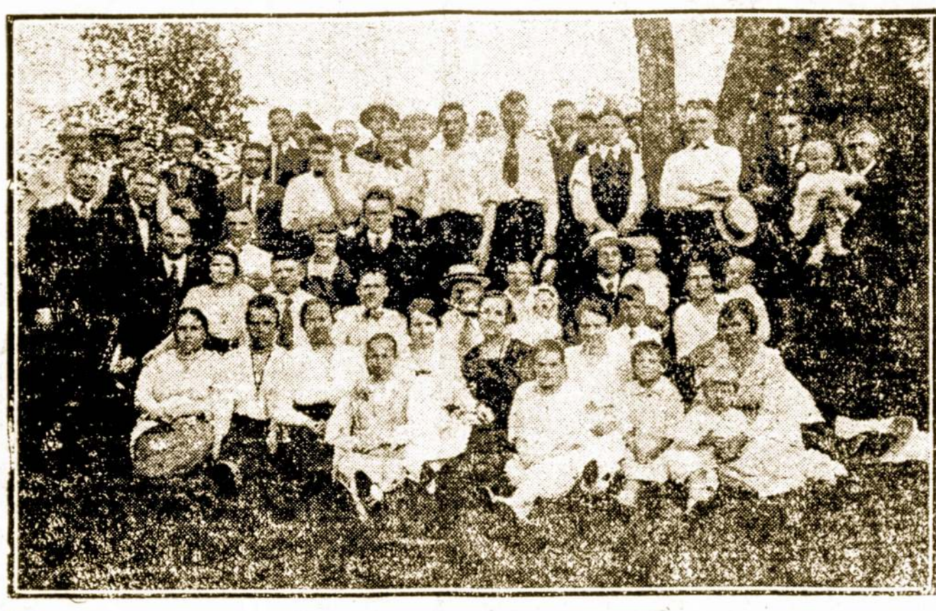
Lowell, Mass. Amerikos Lietuvių Tautinės Sandaros 49 kp. draugiškas išvažiavimas ant ukės, kurio platus aprašymas telpa šiame "Sandaros" numeryje ant 2-ro puslapio.

Iš Warszawa žinios birželio 2 d. patilpusios Amerikos spaudō- je apie lenkų užleistus nagus ant Lietuvos su melu ir bluffais skelbiamos maž-daug šitaip: "Apleido Lenkų javus. —Vo- kiečiai apleidžia Suvalkus. Len-