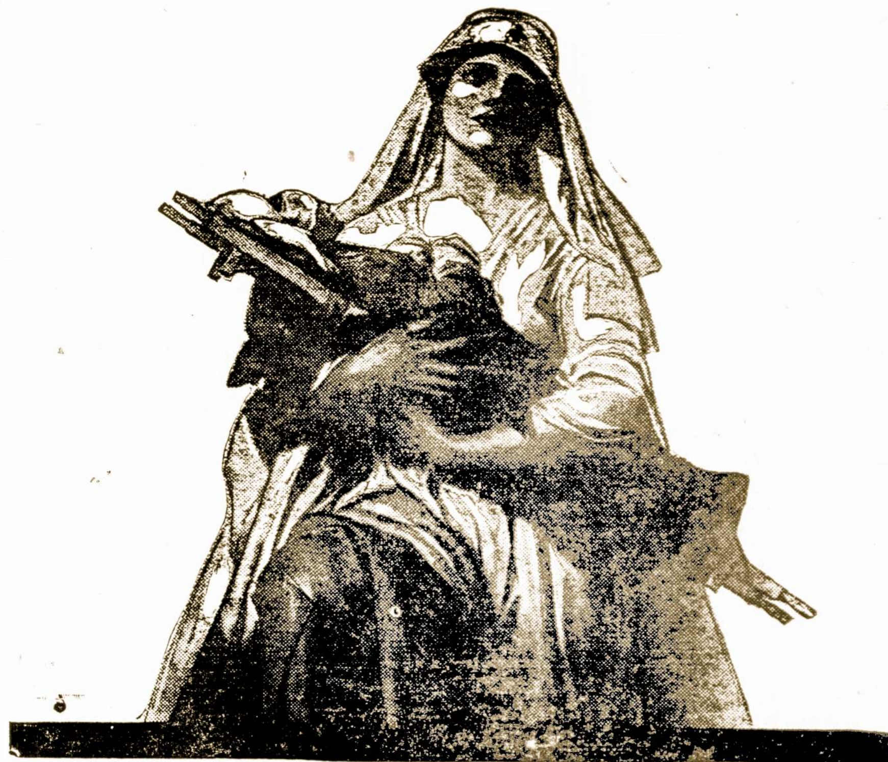
"Nuoširdžiausia Motina Pasaulyje"

Visam Pasaulyje - Europoje, Azijoje, Chinijoje ir Amerikoje - kur tik yra nelaimės ir vargai - Amerikos Raudonasis Kryžius ten gelbsti ir ramina.