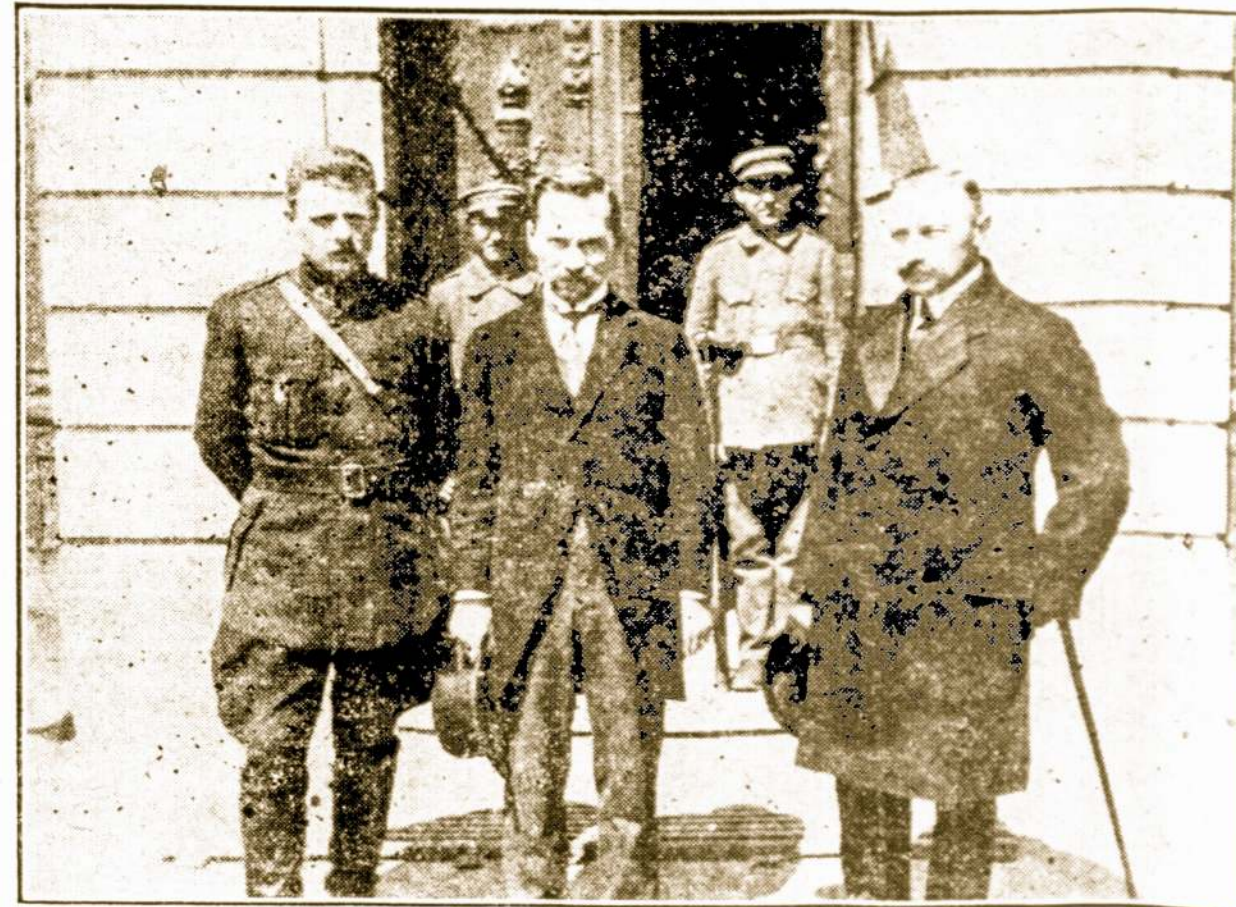
Smetona su Štabo Nariais.