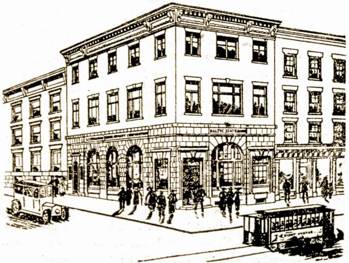
BALTIC STATES BANK, Kapitalas ir Surplusas $270,000.00.

357 BROADWAY, SO. BOSTON, MASS. Telefonas So. Boston 1061.