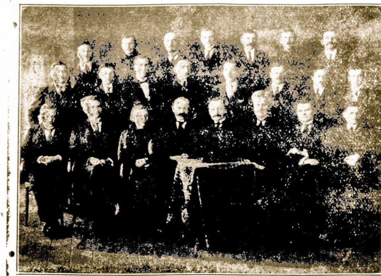
LIETUVOS STEIG. SEIMO VALSTIEČIŲ SĄJUNGOS IR SOCIALISTŲ LIAUDININKŲ DEMOKRATŲ FRANKCIJŲ BLOKO NARIAI (VISO 28):

Pirmosios Kauno Gimnazijos mokiniai ir mokinės šių metų birželio mėn. padarė garlaiviu ekskursiją Klaipėdon, kad arčiau pažintų tą vienintilį Lietuvos uostą. Klaipėdiškiai lietuviai labai širdingai priėmė Didžiosios Lietuvos moksleivius, ir kad nereikėtų moksleiviams sustoti viešbučiuose, kiekvienas naėmė pas save po vieną kitą jauną svečią. Išvažiuojant iš Klaipėdos, moksleivių orkestras norėjo užgriežti Lietuvos himną, bet vietinė policija jiems tai uždraudė. Tuomet vienas iš palydėjusių minios prūsų lietuvis susuko: "Bet visgi neužmirškite, kad mes esame Lietuvoje!" Tie žodžiai taip sujudino moksleivius, ir stovinčių ant kranto minia, kad šauksmams "Valio," "lai gyvuoja Lietuvos Klaipėda!" nebuvo galo. Jaunuoliai patrijotingo upo pagauti verkė, taip pat riedėjo ašaros ir lydėjusiems juos prūsų lietuviams, mačiant priaugančią gražiai auklėjama savo tautos kartą, pilną energijos, entuziazmo ir didelės Tėvynės meilės. Liet. I. B.