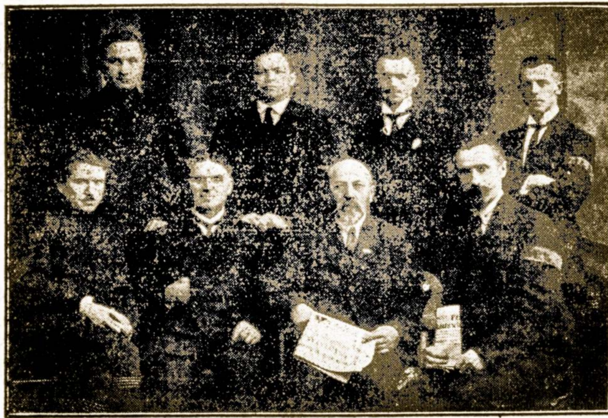
KLAIPĖDOS V. GELBĖJIMO KOMIT. NARIAI IR RĖMĖJAI.

Dėl logiškai nesuprantamų priežasčių Lygos Taryba dabar išsprendė, kad ši zona būtų skaitoma demarkacijos linija, be įtekmės į galutiną išsprendimą. Lietuviai, žinoma, neapsiėmė pritari ti tokiai abejotinais metodais paversti Lenkijai žemes ir priešinosi lenkų brivimuisi. Iš to kilo mušiai, kuriuose šiaurės Slavai (taip čia klaidingai vadinami lietuviai.—Red.) padarė skaudžią klaidą suareštuodami Anglijos generolą, kurs daboj visas