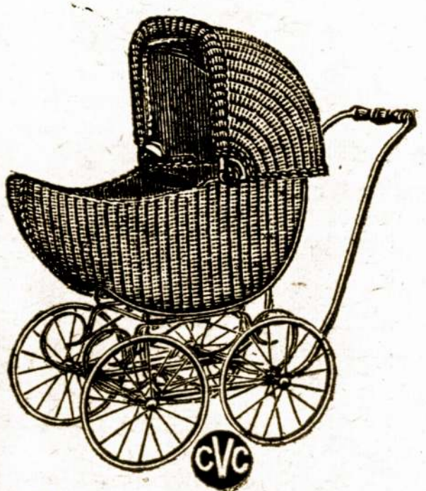
Nendriniai vežimėliai — turime gerą rinkinį vežimelių visokių mādų ir spalvų. Parsiduoda už $17.50 ir augščiau.