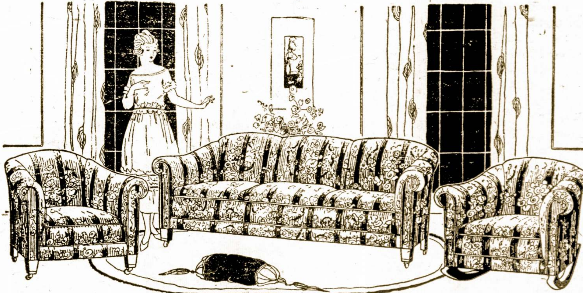
Rakandų grupė susidedanti iš trijų minkštai priklimtų daiktų, kurių sėdynėse įdėtos sprenžinos ir kiekvienas rakandas apdarytas su Velom ir kitais audeklais. Pirmiau buvo parduodamas už 50 nuoš. daugiau. Šių grupių rakandų prekės apėmis yra nuo $98 ir brangiau.

KAD PADARYT VIETOS PERDIRBIMUI KRAUTUVĖS, MES ESAM PRIVERSTI AUKUOTI $75,000 VERTES RAKANDŲ, KURIUOS PIRKdami TAMSTOS GALĖSIT SAU SUTAUPYT 50%.