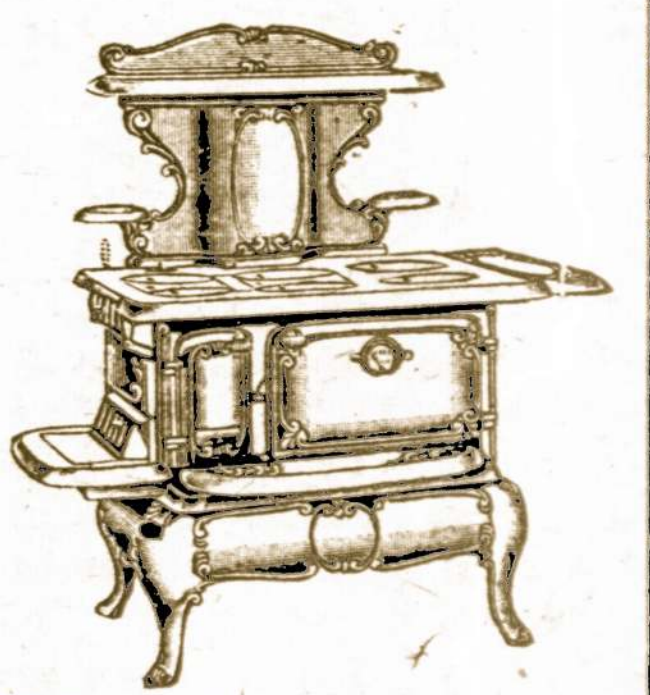
Paliravoti Pečiai keliose spalvose, ant kurių garantuojama geras kepimas ir virimas. Šį pečių yra lengva užlaikyti švairiu. Parsiduoda už $49 ir daugiau.