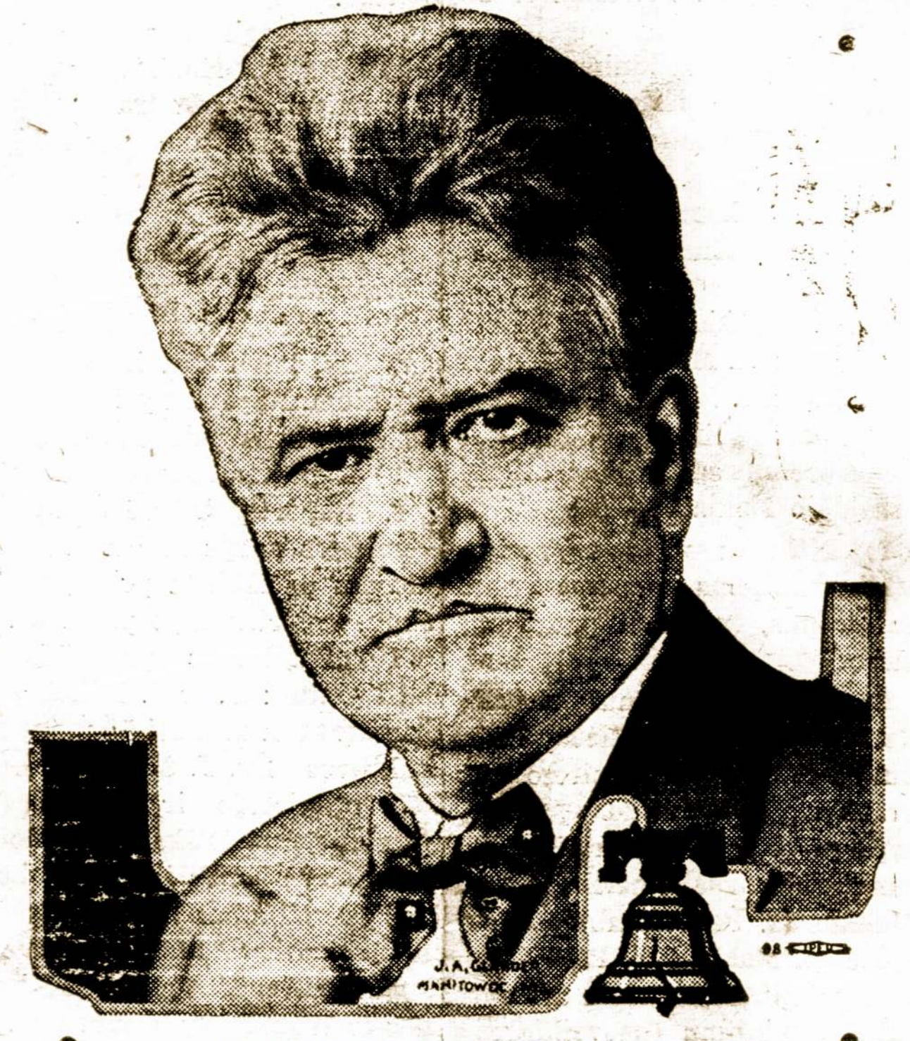
ROBERT M. LA FOLLETTE

ROMA, birželio 19 d. Šiandien Italijos parlamentas 274 prieš 42 balsais priėmė bilingvą, kuris suteikė valdžiai dar didesnės, negu lig šiol turėjo, galios. Šis naujas bilius suteikia fašistams leidimą pašalinti valdiškus darbininkus iš vietų vien tik dėl politinių priežasčių. Premjeras Benito Mussolini nurodė, kad tarp Valstybės samdinių esą daug tokių,