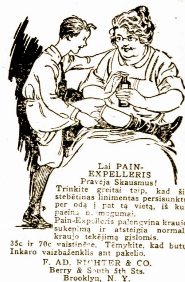
Lai PAIN-EXPELLERIS Praveja Skausmus! Trinkite greitai taip, kad šis stebėtinai limmentas persianktų per odą į patį tą vietą, iš kur painis n. migumai. Pain-Expelleris palengvina kraujo sukėtimą ir atstiegia normalį kraujo tekėjimą į galvas. 35c ir 70c vaistinėse. Tėmykite, kad butų tinkaro vaizbaženklis ant pakelio. F. AD. RYCHTER & CO. Berry & South 5th Sts. Brooklyn, N. Y.