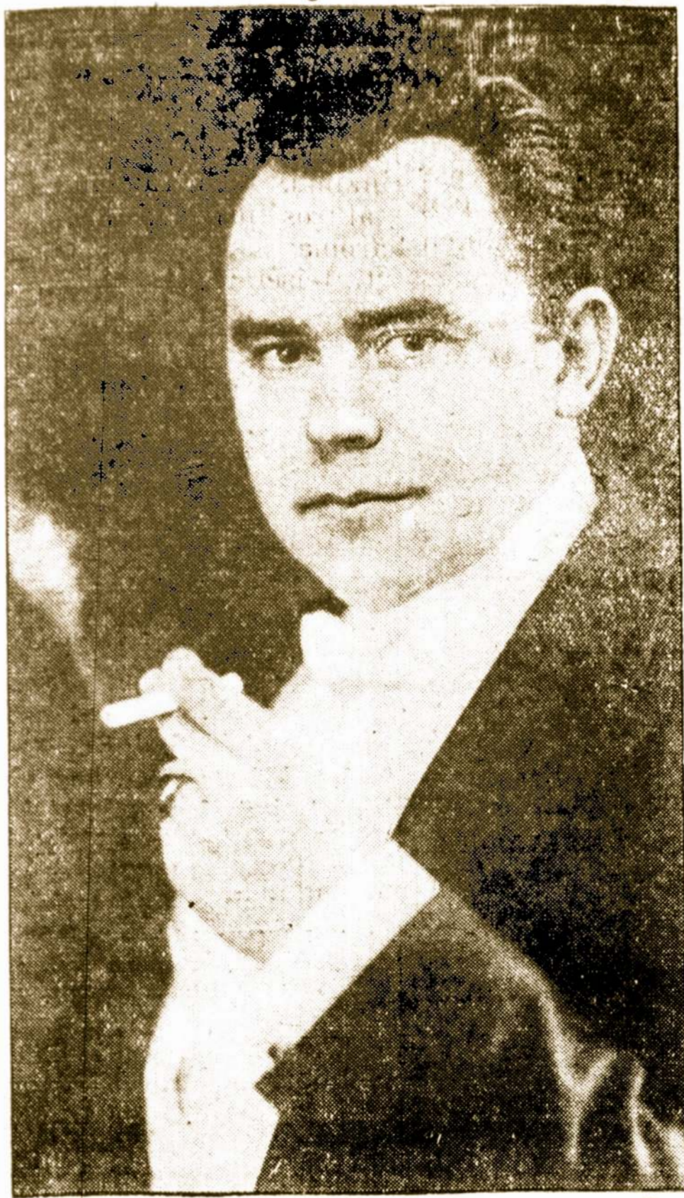
ADVOKATAS NADAS RASTENIS, dabartinis XIII Seimo Chicagoje išrinktas ALTS. Prezidentas.