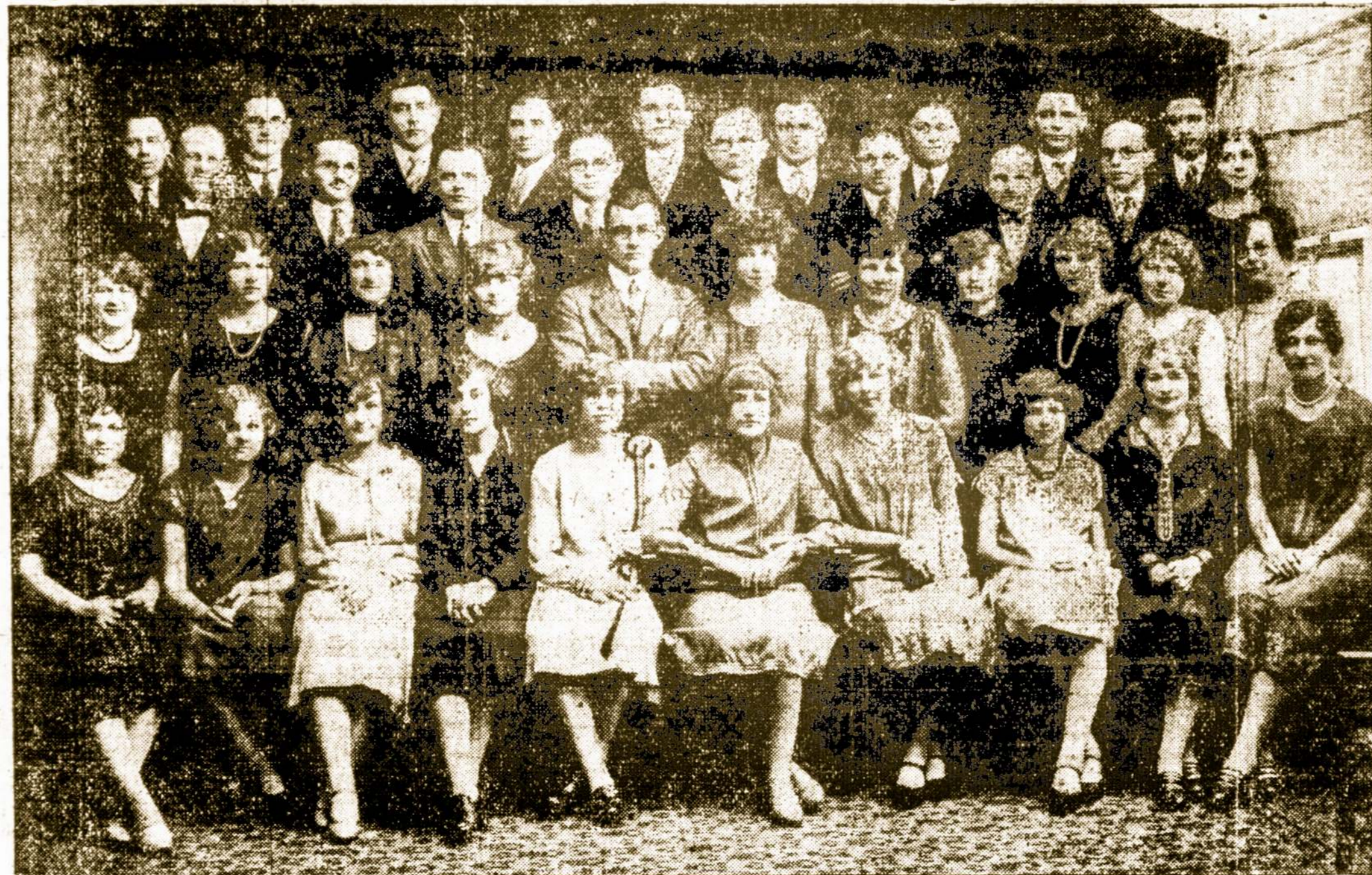
GABIJOS CHORAS, iš So. Boston, Mass.