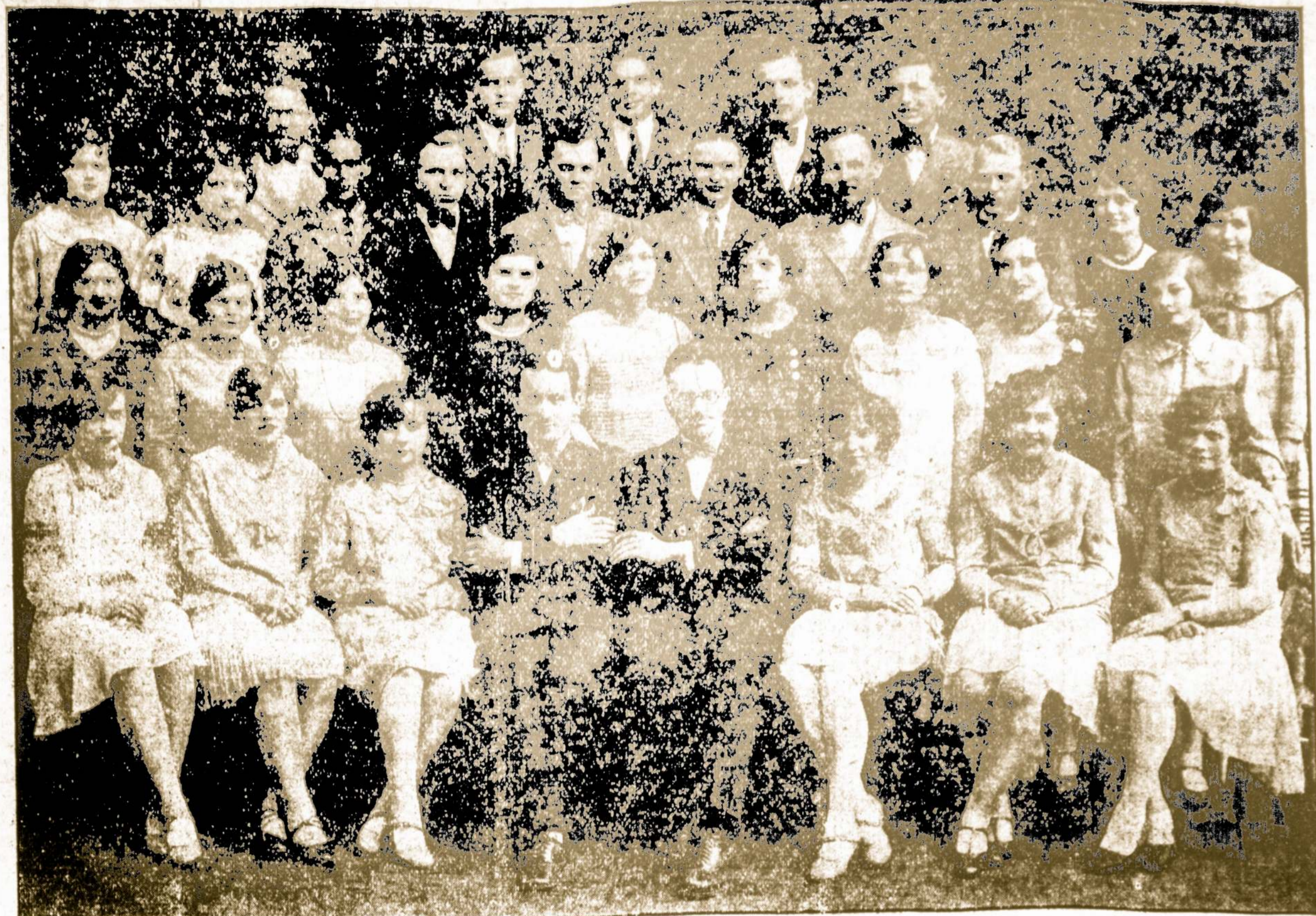
Hartfordo SLA. Jaunųjų Choras, kuris dalyvauja Sandaros 2-ro apskričio piknike Rugpjūčio 12, Glastonbury, Conn.

Paroda šiemet didžiausia, gausiausia paviljonais ir eksponatais. Daugiausia dalyvauja vietos prekybos ir pramonės įstaigų. Ypač gausus ir vertas susidomėjimo gyvulininkystės skyrius. Matomai ir užsienis labiau, negu kitais metais susidomėjimo mūsų paroda, atvažiuo ir yra žinių, kad atvažiuoja daug ekskursijų iš Latvijos, Estijos ir Vokietijos. Iš daugelio valstybių yra atvykę žurnalistai ir žemės ūkio darbuotojai, agronomai.