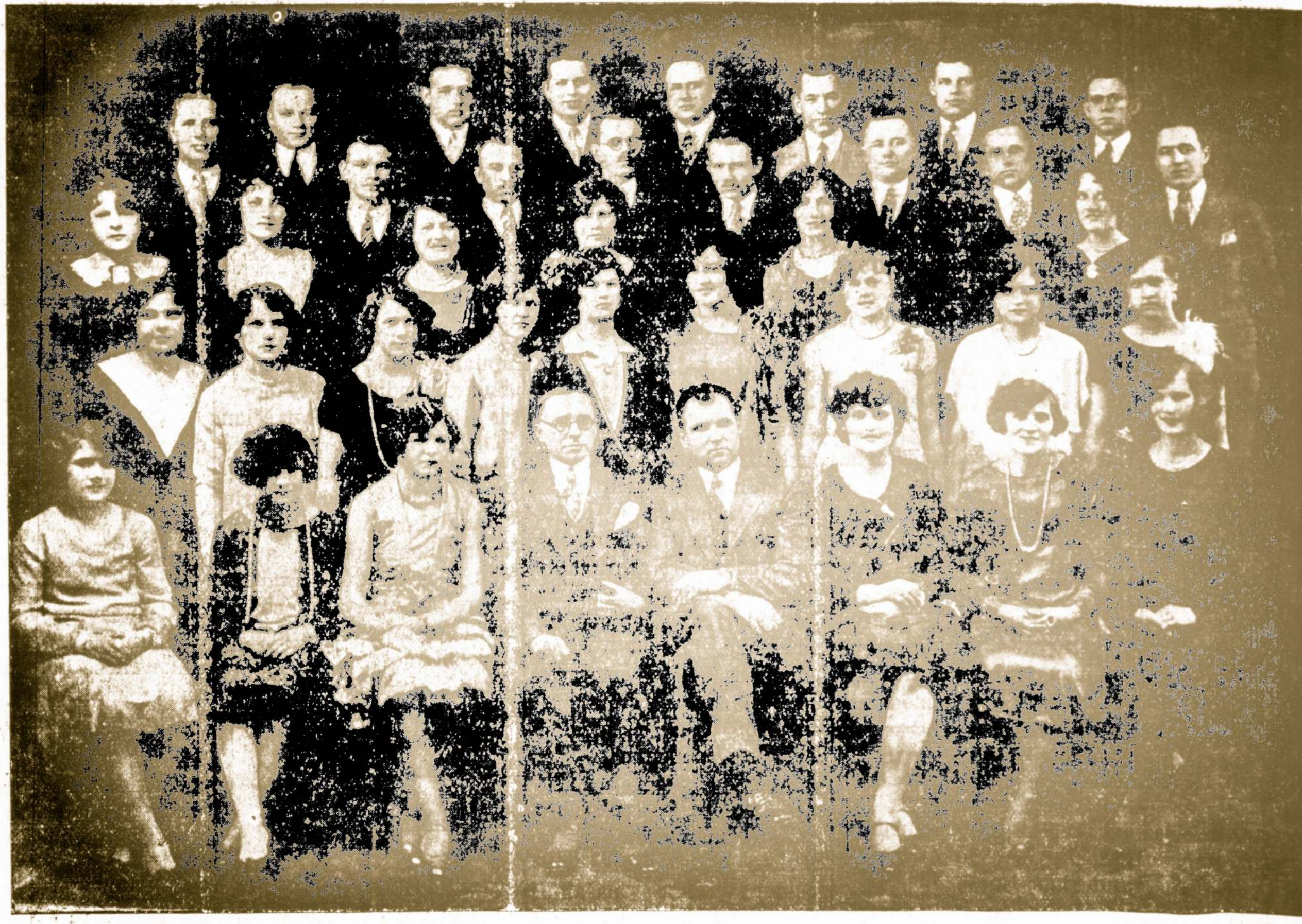
OPERETES CHORAS IS BROOKLYN, N. Y.

RENGIA L. N. VARPO DRAUGIJA IS NEW BRITAIN, CONN.