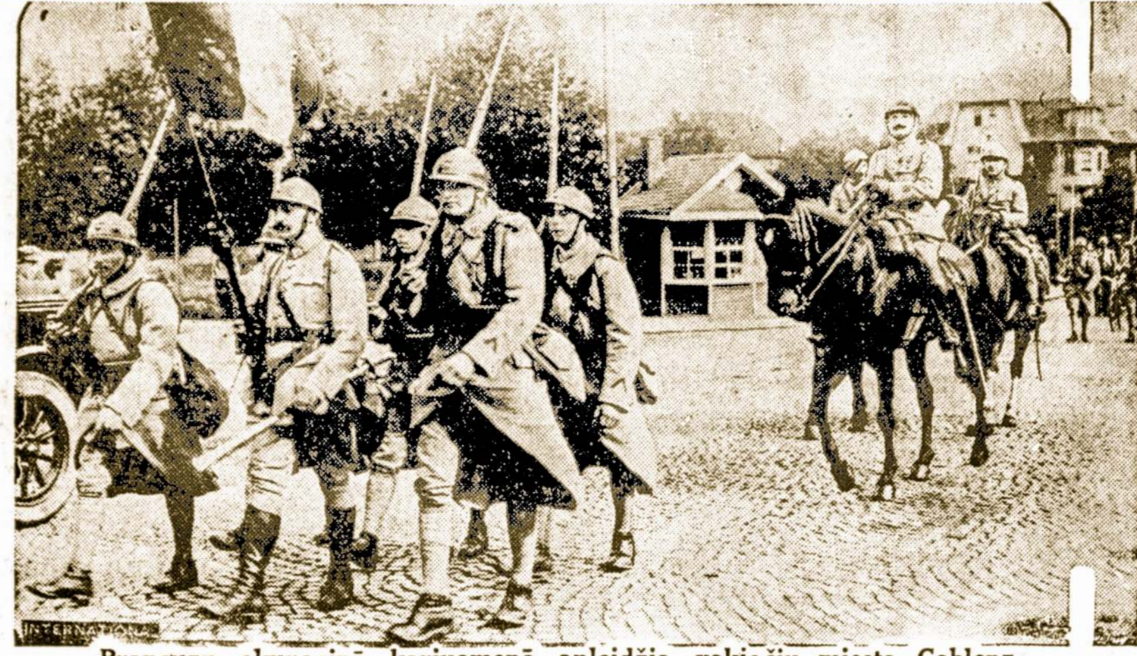
Prancūzų okupacinė kariuomenė apleidžia vokiečių miestą Coblentz.