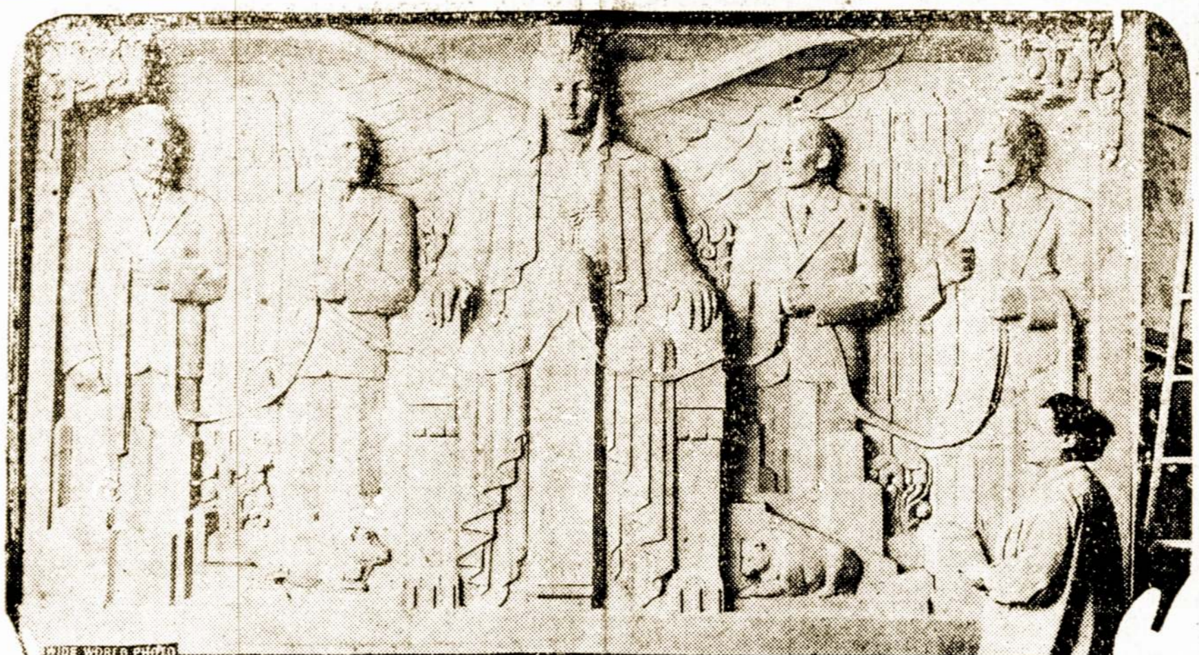
Skulptoriaus Cartono Crapit ta struktura, kuri bus pastatyta Stock Exchange naujo namo prieangyje. Ji kainuoja milijoną dolerių.

Pačiam Agabekovui buvo pavesta nužudyti Biesedovskį. Tokį įsakymą davęs jam GPU užsienių skyriaus viršininkas Trilisser.