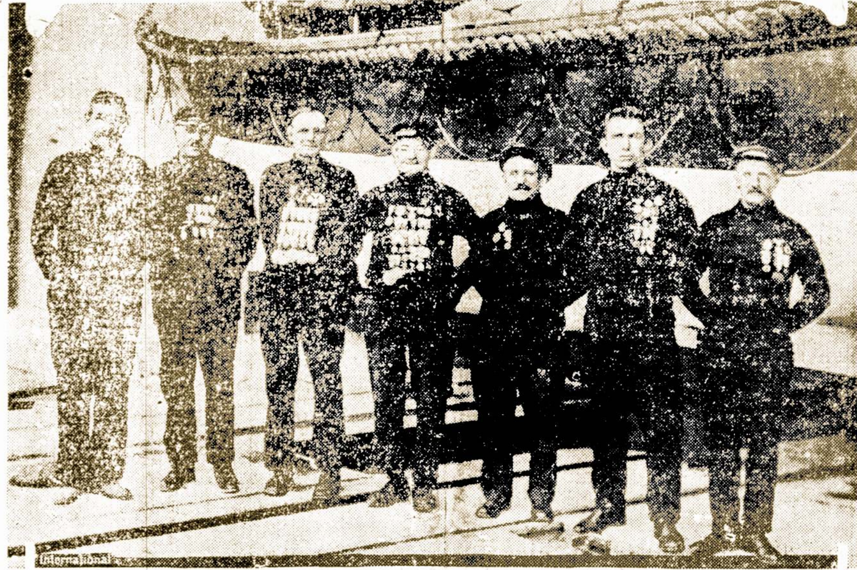
Prancuzų laivo "Marchal Foch" jurininkai daugiausiai išgelbėję gyvasčių.

Dar viena naujienybė. Čekoslovakijos sostinėje žadama įvesti dramblių lenktynę, nes dabartinės lenktynės pradeda nusibosti publikai.