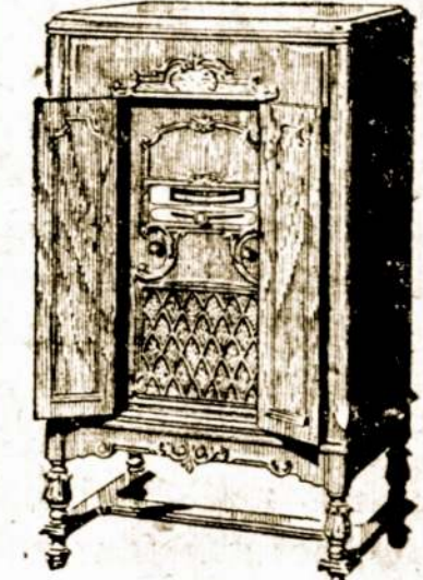
Naujas 1931 metų Mados Kombinacijos Victor Radio