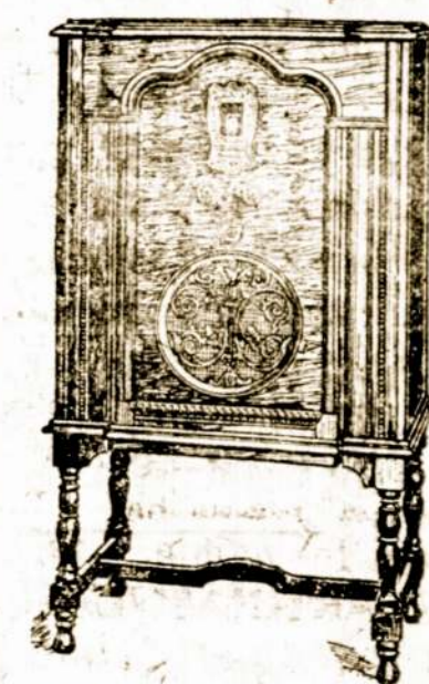
Naujas 1931 metų Mados Kimball Radio

Visuomenė yra užprašyta atilankyti PEOPLES Krautuose šį mėnesį ir pamatyti Naujus 1931 metų mados radios, visų pasizymėjusių Amerikos radio išdirbysčių produktus, kaip tai: