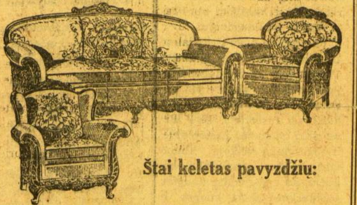
Štai keletas pavyzdžių:

Uždarbiai užmiršta—didžiausiai bargenai. Nes mes turime duoti darbo savo darbininkams, todėl perkanti visuomenė dabar turi geriausią progą sutaupyti