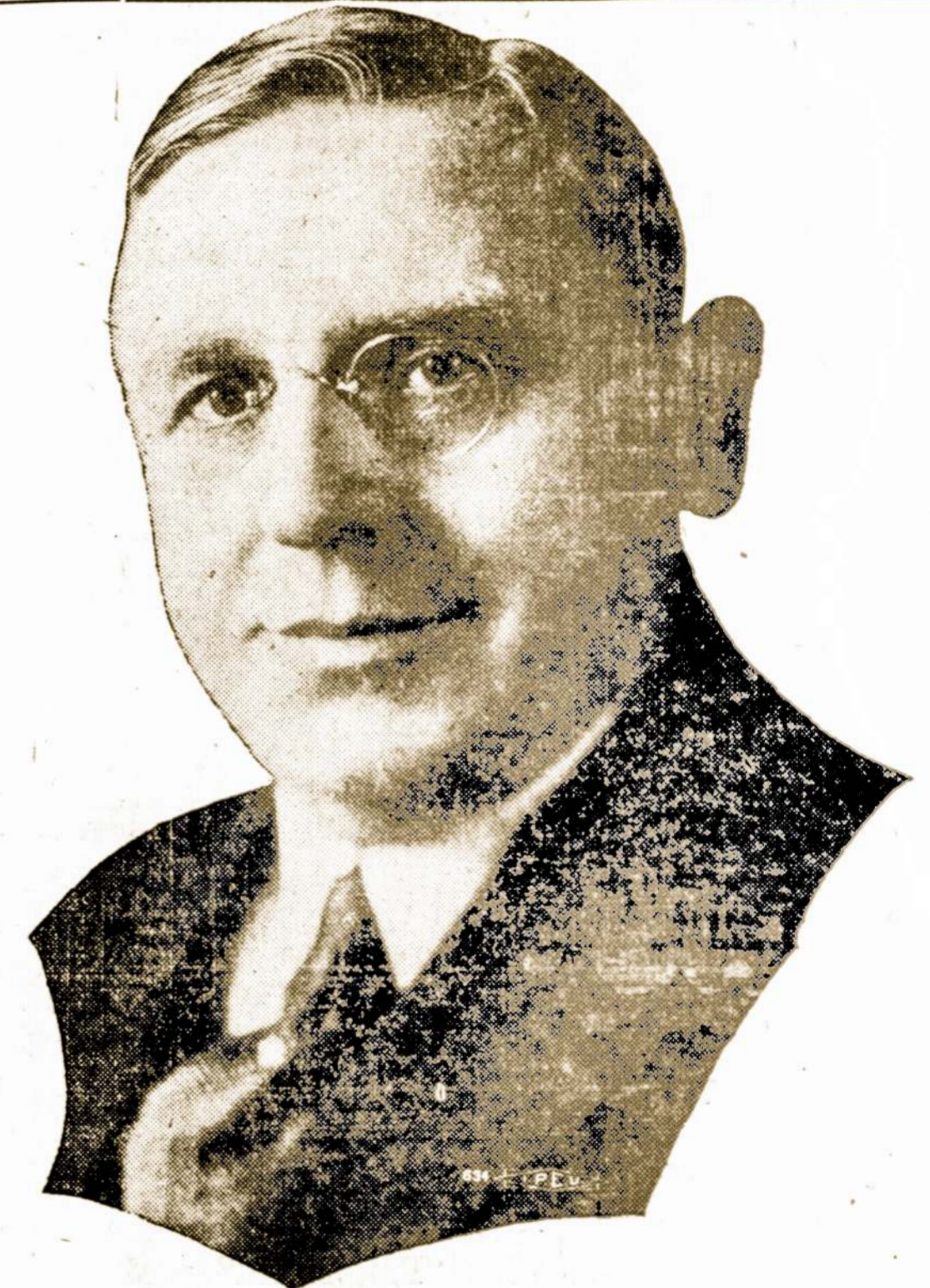
ANTON J. CERMAK