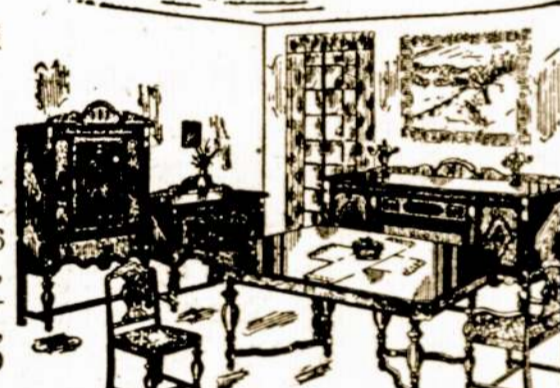
Parlor Setai Parsiduoda už mažiau kaip Wholesale kainos.

Šis gražas 7-nių smutų kombinacijos, riešuto medžio setas, padidinamas stalas ir 6 kedės su gražiomis sėdynėmis, vertas $75.00, dabar prieš padėkavones dieną, kol teksime, parduosime tik po $39.50