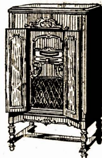
Stebėtinai Radio Pasiuylmas

Tik prieš Padėkavones dieną duodame $10.00 dovanos su pirkimu kiekvieno Naujos mados, pilnos mieros, 8 tubų ar daugiau radio. Pavydžiui: