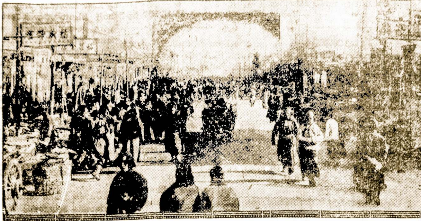
Tipiška Chinchow gatvė. Tas miestas tapo japonų užimtas ir jį gynę kinų kareiviai tapo nustumti už didžiausios kinų sienos.