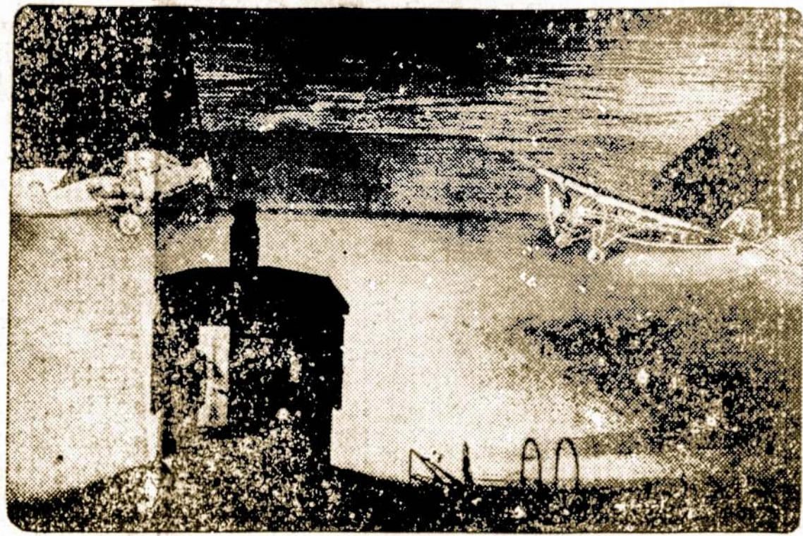
Neseniai užhaigtas statyti švyturys, pagelbėjimui orlaiviams saugiai nusileisti. Nakties metu jo šviesa matosi 100 mylių toleme.

Hamburg. Susikirtime tarp fašistų ir komunistų buvo vienas žmogus užmuštas ir kelias sužeistų. Policija besikaujančius sustabdė ir 40 iš jų suareštavo.