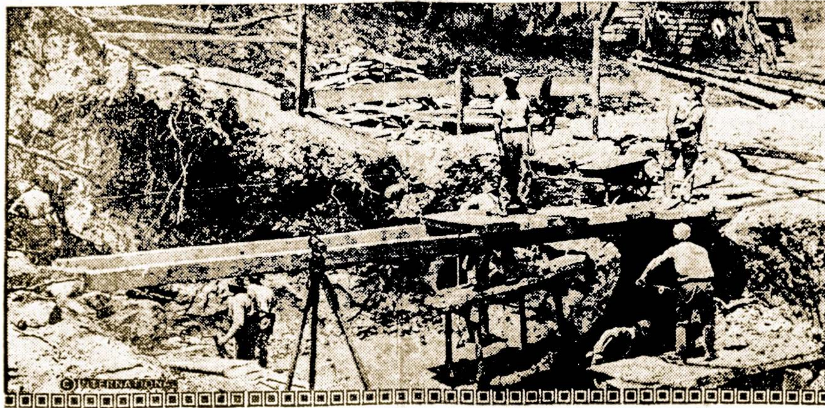
Darbininkai taiso Jurgio Washingtono degtinės varyklą, netoli Vernon. Kuomet ji bus atremontuota, ji bus rodoma žmonėms kaipo istorinė Amerikos liekana.

domės. Nors daug ką mes apleidžiam ir užmirštam, tačiau su sekančiu sezonu reiktų pradėti platesnis apšvietos darbas mažesniųjų tarpe.