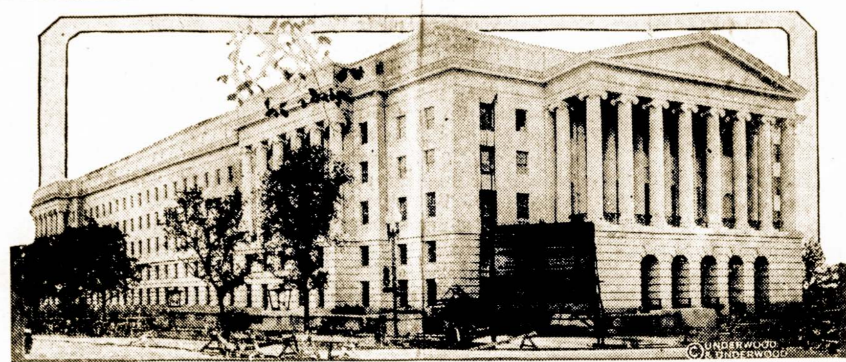
Naujasis Kongreso namas, kuriame bus raštinės visų kongreso narių.

Ten gerai, kur mūsų nėra. Lietuvos žmonės vis dar mano, jog svetimos šalyse, tai aukso kalnai. Štai del ko tiek daug išvažiuoja.