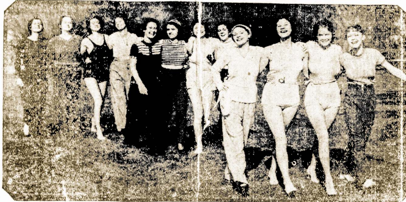
Amerikos turtuolių dukterys rodo kokie rubai yra dėvimi šiomet Ramiojo vandenyno rezorte, Santa Monica, Kalifornijoj.