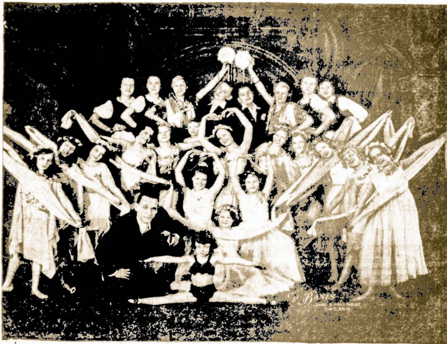
JAUNOSIOS BIRUTĖS BALETAS Dalyvauja Sandaros Piknike.