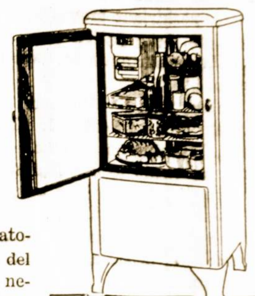
Ypatybės Naujo Modelio V KELVINATOR

Šis Modelis V Kelvinatoriaus specialiai padirbtas dėl šeimos kuklių įeigų. Bet nereikia suprasti, kad čia yra mažas refrigeratorius. Paminėtinė sudėtis, konstrukcija ir kokybė yra lygi su daug brangesnių modelių. Šis Kelvinatorius per daug žemai įkainuotas. Jus galite išigyti už mažiau negu 14 centų į dieną, ant mūsų prieinamo išmokėjimo plano.