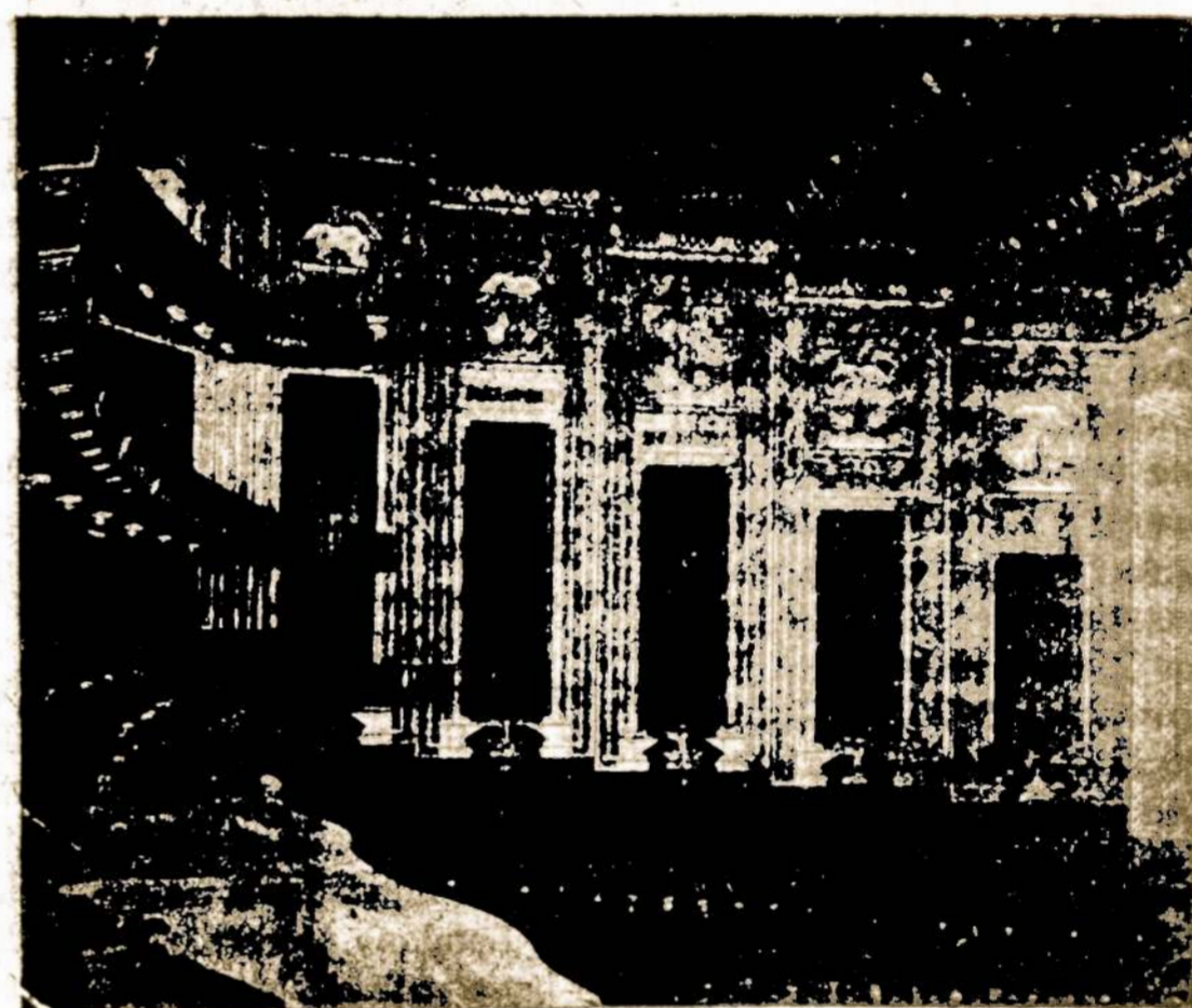
"MUZIKA — MUZIKA"