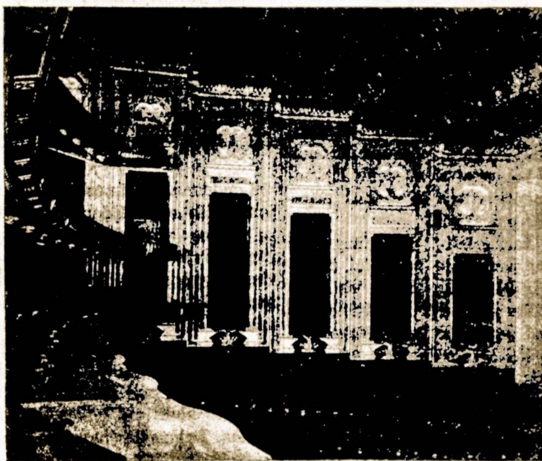
"MUZIKA — MUZIKA"

Margučio naujusias muzikalis kurinys "Muzika—Muzika" jau repertuojamas. Margutis. Margutis pasižymėjo dabartinia me muzikos sezone.